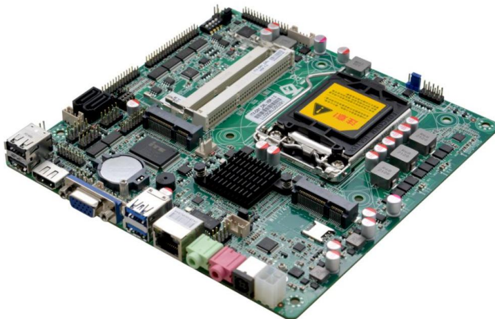
ITX-D81_D6L VER:1.0 主板侧面